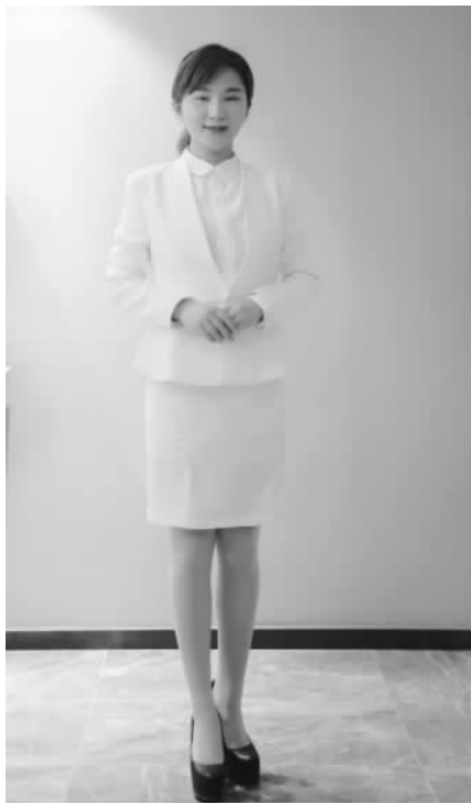
图 2-8 女士直立站姿

手背后相搭在臀部,两腿并拢,脚跟靠紧,脚掌分开呈“V”字形或并拢(男女都适用,男士两脚可以略分开站立)。女士直立站姿如图 2-8 所示。