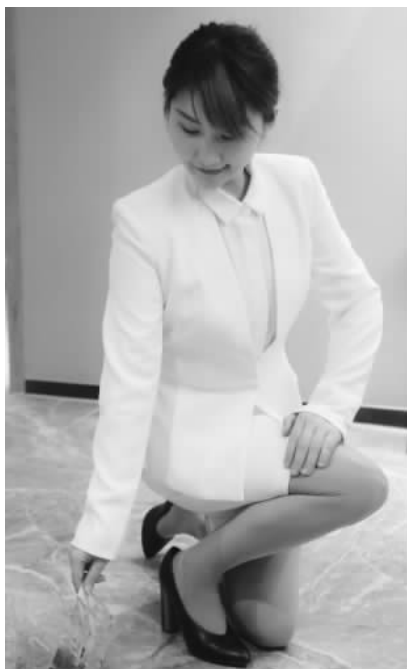
图 2-11 下蹲拾物姿态

总体来说,蹲姿的要点是,脊背保持挺直,臀部一定要蹲下来,避免弯腰翘臀的姿势。男士两腿间可留有适当的缝隙;女士则要两腿并紧,穿旗袍或短裙时更要留意,以免出现尴尬。另外,注意下蹲时,内衣不可以露出来。