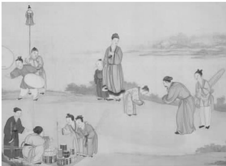
图 1-3 我国古代的鞠躬礼

我国古代的鞠躬礼如图 1-3 所示。鞠躬原本是我国民间最常用的礼节,是一种表达恭敬的形体语言。鞠躬礼传到日本、朝鲜后,为当地全面接受,流行至今。日本的鞠躬礼很讲究,依据对象的不同分为三等:最高的一等是 90°鞠躬,用于拜见身份很高的尊者或长辈,称为“楷礼”;中间的一等约 45°鞠躬,是正式场合中比较常见的一种,称“章礼”;最低的一等相当于我们说的欠身,其比点头郑重一些,用于不太正式的场合,称“草礼”。在日常生活中,无论是用楷礼、章礼,还是草礼,礼是一定要有的,否则就是失礼。