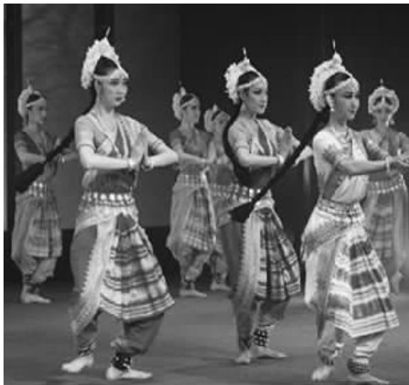
图 1-1 印度的婆罗多舞

印度古老的舞蹈婆罗多舞,在印度语中的意思是“舞蹈的艺术”。它除了强调舞蹈的节奏感外,还强调伴奏的音乐必须悦耳动听,由庄重的诗歌和风格纯朴的音乐组成。它本是用于祭祀的舞蹈,充分体现了舞者的情感,其最初由神庙舞女在庙宇里表演。作为祭祀礼仪的舞蹈,其动作有严格的规范。该舞蹈的动作关键在于保持上身的挺直,腿部半弯,双膝分开,而双脚则要像一把半开的扇,如图 1-1 所示。