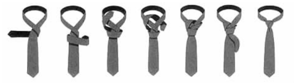
图 2-3 交叉结打法

③ 温莎结打法。温莎结打法一般用于商务、政治等特定场合。该打法非常漂亮,属于典型的英式风格。其步骤在几种最常用的领带打法中也算是最复杂的了。温莎结打法适合用于着宽领型的衬衫,不适于材质过厚的领带。该打法应多往横向发展,领结也勿打得过大。