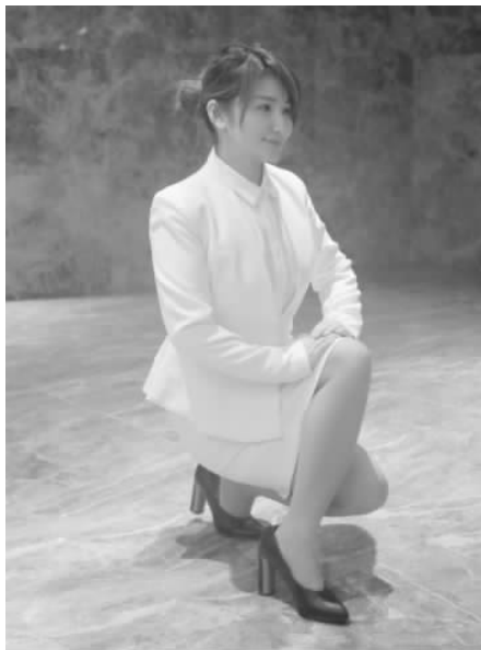
图 2-10 女士蹲姿

度。比较理想的蹲姿应该是用目光示意后有准备地下蹲,双腿最好保持一前一后,腰脊挺直。女士蹲姿如图 2-10 所示。