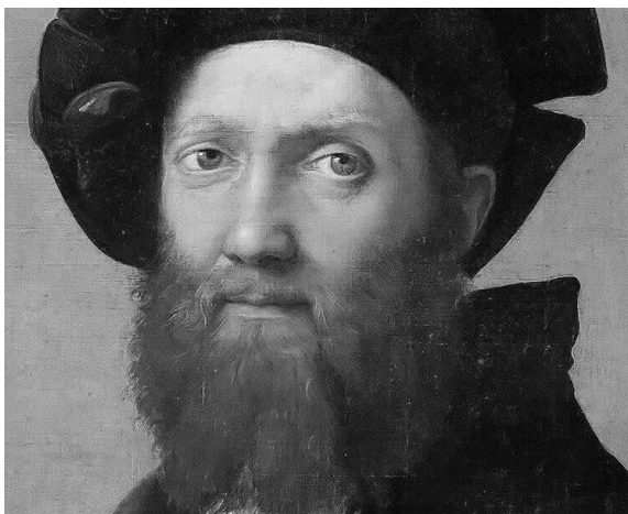
图 2-7 《巴尔达萨雷·卡斯蒂利奥奈》

现藏于巴黎卢浮宫,由意大利著名画家拉斐尔所画的《巴尔达萨雷·卡斯蒂利奥奈》(如图 2-7 所示)真切而生动地反映了画面主人公集政治家、外交家兼学者于一身的形象特征,他那双黑亮的眼睛透出的锐利而又平和的眼神好像能够看穿一切,显示了他的自信、果断、严谨,显示了意大利 16 世纪文艺复兴时期学者特有的风范。该画作传神的眼神表现使画面主人公显得更亲切、平和,更能接近一般欣赏者的审美口味。