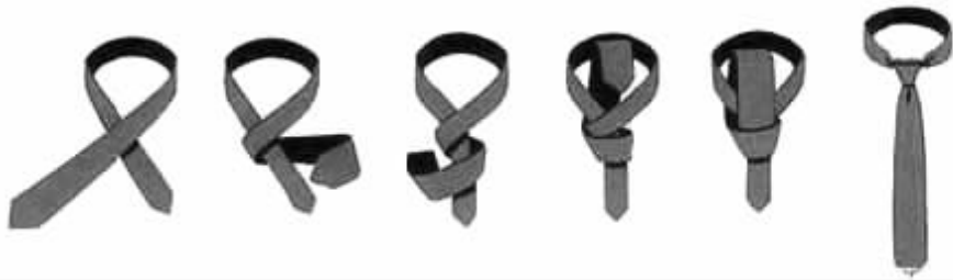
图 2-2 平结打法

第五步,将大端插入形成的环中,系紧,注意领结下方所形成的凹洞应看起来两边均匀且对称。