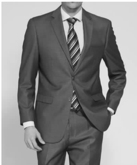
图 2-1 西服套装和衬衣

(1)西服上衣。标准西服上衣的衣长应该是在着装者自然站立时,将手臂下垂,手掌放松略为弯曲,其底边正好在手指尖处。