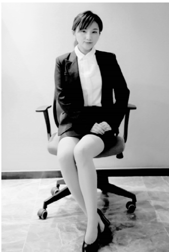
图 2-9 女士“S”形坐姿

(3)女士“S”形坐姿。坐正,上身挺直,双腿并拢,两腿同时侧向左或侧向右,两脚并放或交叠,双手叠放置于左腿或右腿上,如图 2-9 所示。