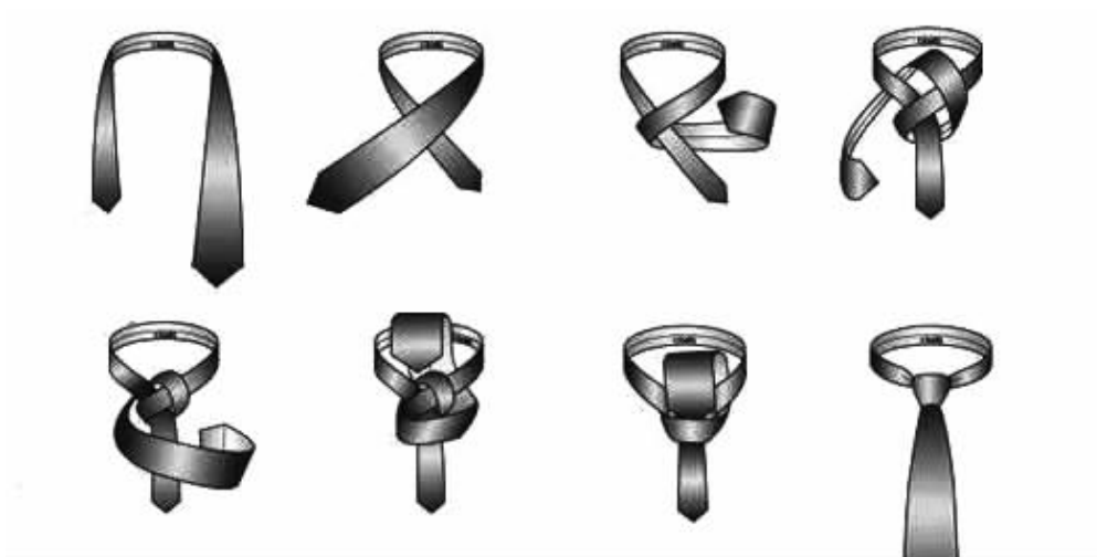
图 2-4 温莎结打法