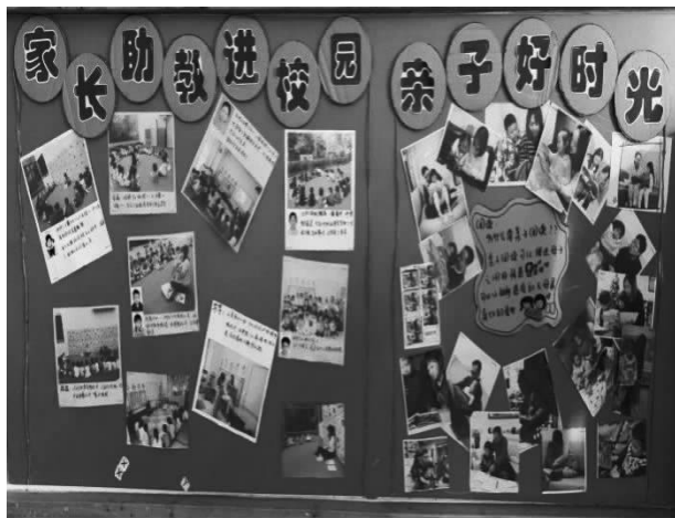
图 4-5 家园活动展示(深圳市南山区华侨城香山里幼儿园)