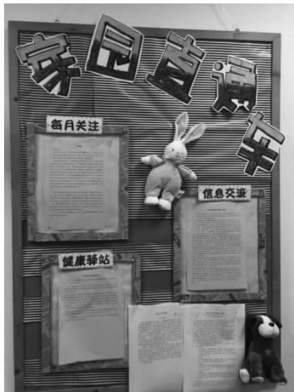
图 4-4 家园互动栏(南京市第二幼儿园)

家园合作的形式很多,如家长会、家访、个别交谈、家园联系手册、家园互动栏(见图 4-4)、家园活动展示(见图 4-5)、家长开放日、家长教育讲座、家长经验交流、亲子活动、教师信箱等。