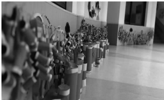
图 4-1 幼儿园布置的“迎新年”

例如,在春节即将来临之际,某幼儿园开展了有关春节的主题活动,教师在教室周围布置了与春节有关的灯笼、贴福字等挂饰(见图 4-1、图 4-2),可让幼儿潜移默化地了解有关春节的知识。