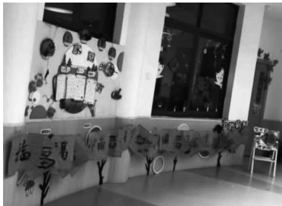
图 4-2 幼儿园张贴的“福”

(3) 树立榜样。榜样可以作为积极环境的一部分,榜样在教育中具有自己独有的地位和价值。班杜拉的社会学习理论指出,学前儿童是通过观察学习的,因此,榜样示范对学前儿童社会教育来说非常有效。