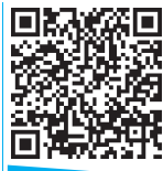
视频 幼儿户外操《运动真奇妙》

从认知到行为是一个复杂的过程。知识是基础，态度是动力，行为是目标。健康知识的传播应着眼于学前儿童的内化程度，培养健康态度应着眼于学前儿童的情感体验，形成健康行为应着眼于学前儿童的自觉主动。健康教育要想调动学前儿童参与的积极性，就要遵循学前儿童的身心发展规律。