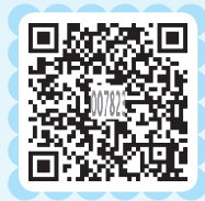
知识拓展 音乐训练的作用

在进行音乐胎教时，应将音源放置在离自己1~1.5米的距离，将音响强度调到65~70分贝。同时要注意的是，戴耳机和将音乐播放设备贴在自己的小腹部实施胎教都是不规范的方法。