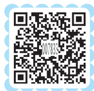
视频 学前儿童音乐能力的发展及其特点