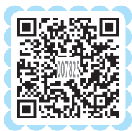
在线测试 材料分析题

音乐虽然是对人类社会生活的主观反映，但由于音乐构成材料的特殊性，这种主观反映与文学、美术等艺术形式对人类社会生活的主观反映完全不同。例如，一幅画作一经完成就是一件独立的艺术作品，并不需要任何媒介就可以供人欣赏；一部小说或一首诗一经完成就可以直接和读者见面，也大致无须其他中间环节；而音乐这类表演艺术则不同，它必须通过表演这个中间环节才能被传达给欣赏者，才能实现其自身的审美价值。