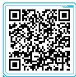
资料 和谐消费环境的 内涵

微观消费环境是指由企业通过各方面工作的有效开展所塑造的消费环境。微观消费环境的主要构成因素包括优质产品和服务的提供,良好企业形象的塑造和各种公众关系的有效处理。微观层次的消费环境是整个消费环境建设的落脚点。